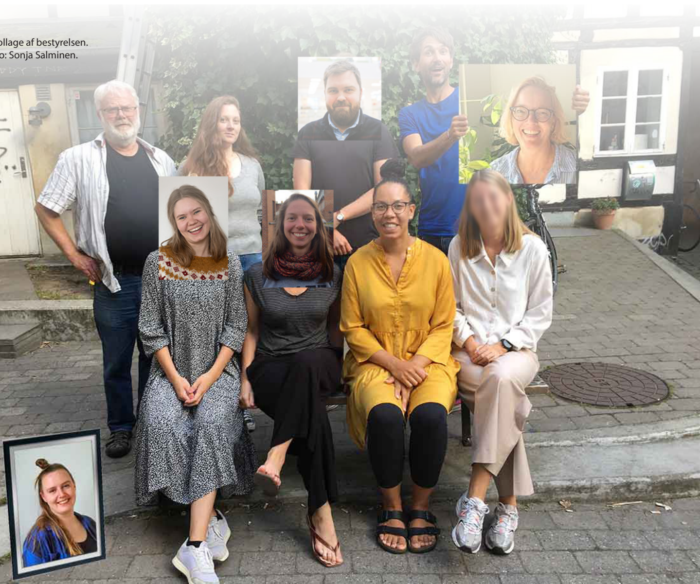
>Collage af bestyrelsen.

I efteråret havde bestyrelsen et strategiforløb med CISU. Dette har mundet ud i en ny formålsbeskrivelse for MUNDU. Afledt af denne proces i efteråret, vil bestyrelsen over det kommende år have fokus på fundraising og strategi.